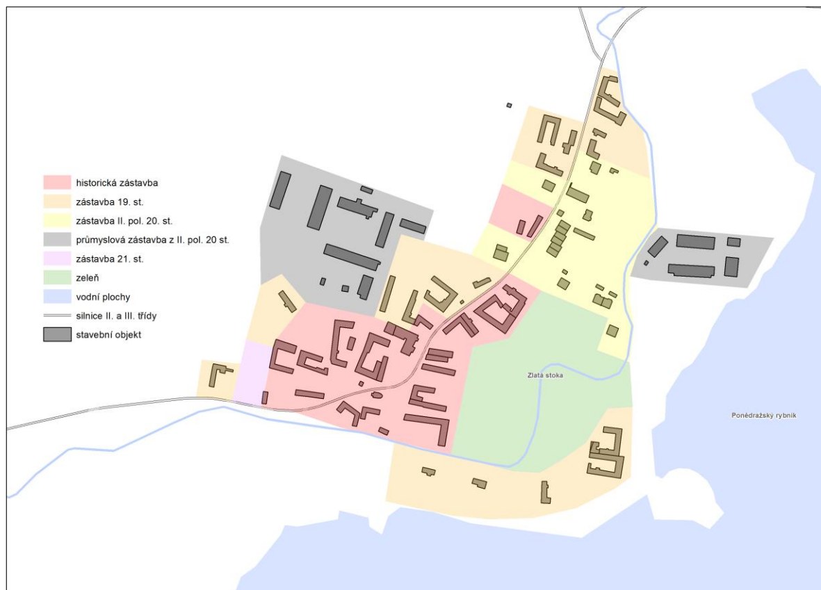
SCHÉMA HISTORICKÉHO URBANISMU PONĚDRAŽE

Roztroušené usedlosti v rybníkářské krajině jsou unikátní urbanistickou formou jižních Čech a podstatně utvářející krajinný ráz místa. Ve správním území obce Ponědraž jsou hned tři takové samoty. Jedná se o samotu Kužel, V Běrdáku a Bašta (jedno ze středisek Rybářství Třeboň). Jedinečnost těchto samot je právě v jejich solitérnosti, kdy zemědělskou usedlost tvoří jen obytné stavení s potřebným zemědělským zázemím bez dalších rušivých staveb (jako je např. chata či nový rodinný dům pro rodinné příslušníky).